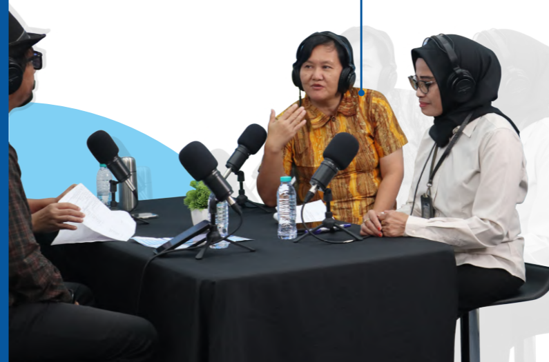
Warga binaan Balai menjadi narasumber dalam PODCAST di Tribun Jogja April, 2024