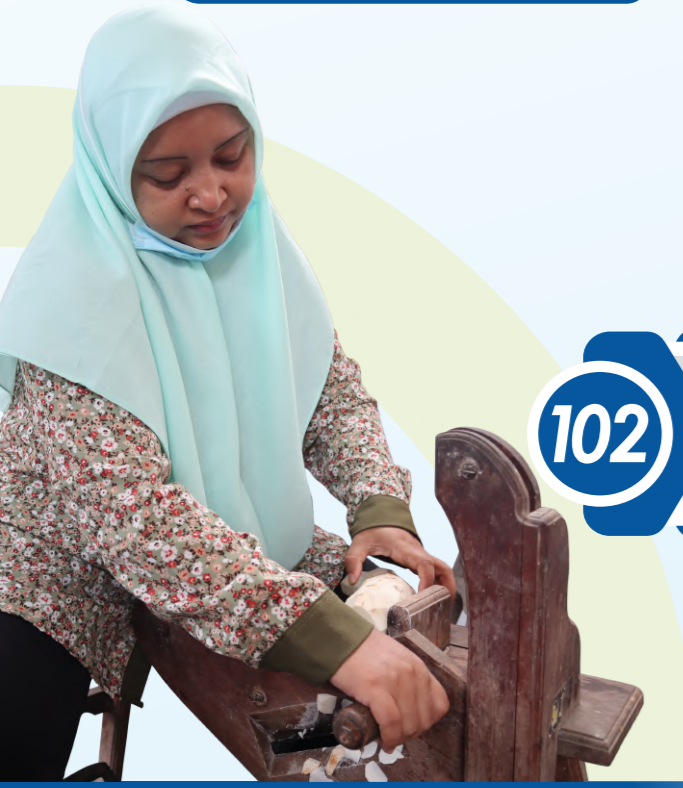
Kelompok Swabantu Disabilitas Psikososial Memiliki usaha produktif pengolahan keripik kentang sebagai bagian dari terapi

102 Keluarga menerima peningkatan kapasitas dan kesiapan melalui layanan Family Support Group (FSG) yang di kuatkan.